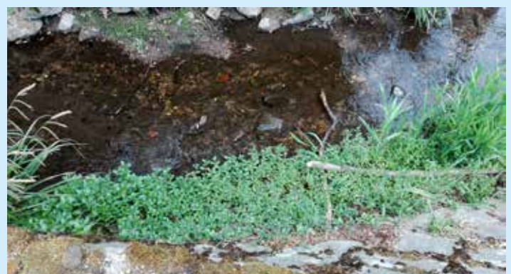
Bachbunze im Frühjahr

Frühling! Nach einem kurzen Winter beehren uns schon seit Wochen Frühlingsblumen und -kräuter. Jetzt könnte auch die Saison für die Kräuterführungen wieder beginnen. Pflanzenkundige machen sich mit Körbchen und Taschen auf den Weg: Die Wasserkresse wächst gut. Scharbockskraut bringt Vitamin C auf den Teller, doch Vorsicht! Ich habe bereits eine gelbe Blüte gesehen; und sobald sich das sattgelbe Blütenmeer zeigt, bitte nicht mehr pflücken! Denn dann bildet sich das schwachgiftige Protoanemonin, das aber doch Übelkeit, Erbrechen und Durchfall auslösen kann. Die Bachbunze sprießt und die Vogelmiere schaut um die Ecke. Die erwähnten Pflanzen sind wasserdurstige Bodendecker und wachsen gerne in Gemeinschaft.